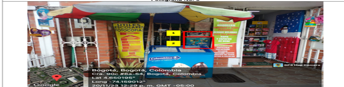
En la cual se observan: dos (2) elementos publicitarios identificados con los números 1 y 2 los cuales se encuentran incorporados en la ventana de la edificación.