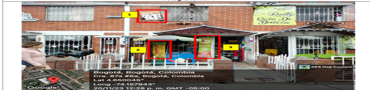
En la cual se observan: tres (3) elementos PEV identificados con los números 1,2 y 3 los cuales son adicionales al único permitido por fachada de establecimiento comercial.