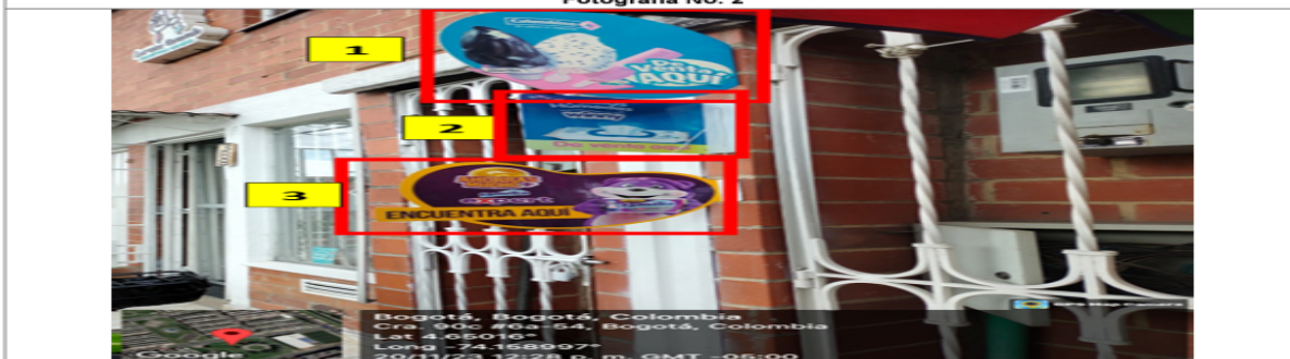
En la cual se evidencian tres (3) elementos publicitarios identificados con los números 1,2 y 3, los cuales se encuentran volados de la fachada y son adicionales al único permitido.